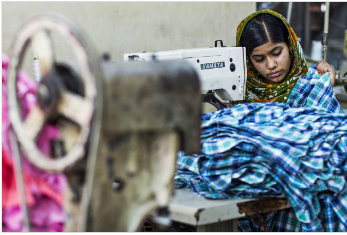
l'heure du début du travail.